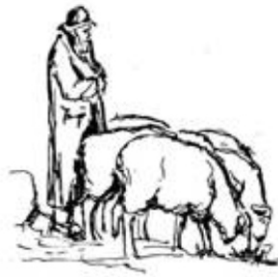
Schafzuchtgenossenschaft 3855 Brienz und Umgebung