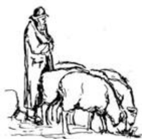
Schafzuchtgenossenschaft 3855 Brienz und Umgebung